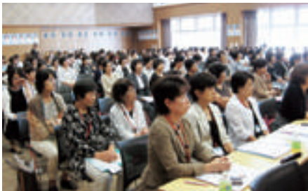
多くの方にご参加頂きました