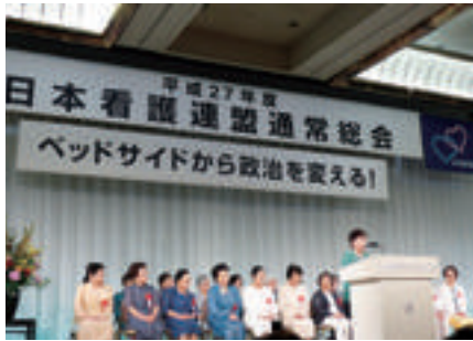
日本看護連盟通常総会