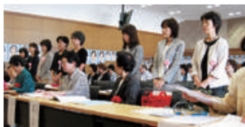
平成27年度会員表彰受賞者（会員歴20年以上） は35名でした。

県役員会・活動報告・決算報告等の報告事項とスローガン・活動計画・予算等6つの提出議案はすべて承認・可決された。 ご協力ありがとうございました。