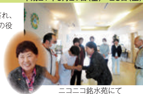
ニコニコ銘水苑にて

※施設訪問 国東市民病院、大分県立病院、佐伯中央病院、ニコニコ銘水苑、 土生医院、大分県立看護科学大学、大分市医師会立アルメイダ病院、 大分記念病院、大分赤十字病院