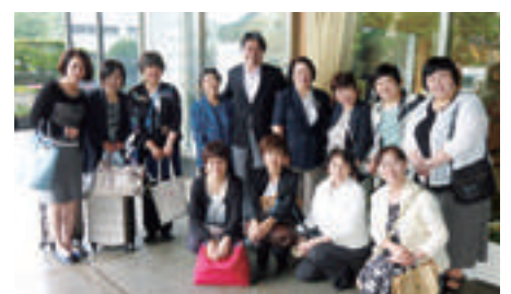
石田昌宏参議院議員と一緒に・・・