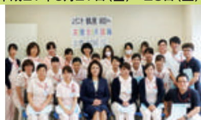
大分県厚生連鶴見病院にて