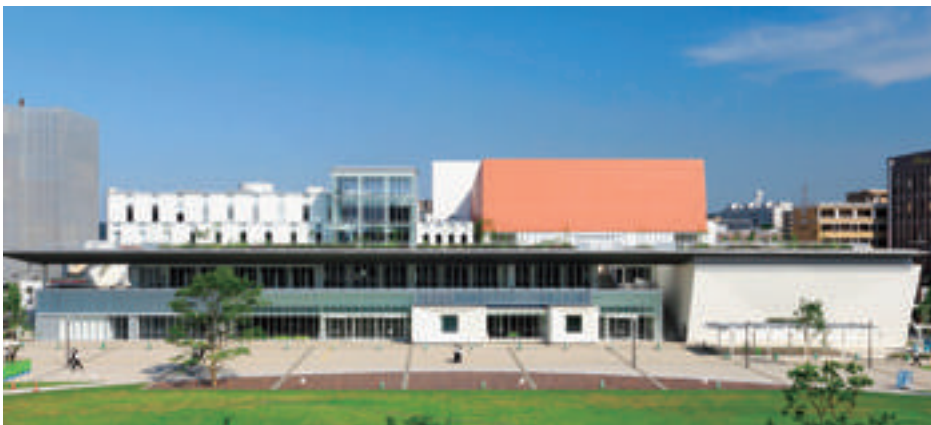
◇ホルトホール大分 JR大分駅 上野の森口(南口)