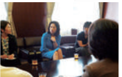
大分県立病院(大分市)

総会と重なった集会でしたが、師長さん方に集まって頂きました。集会后は、政策推進集会へも参加して頂きました。