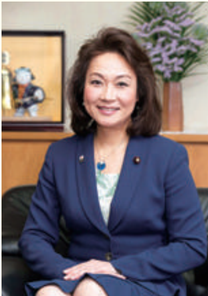
参議院議員 たかがい 恵美子