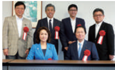
応援のあいさつを頂いた 国会議員・県議会議員の方々