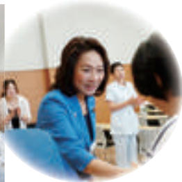
国東市民病院 (国東市)