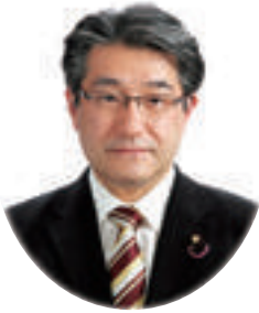
参議院議員 石田 昌宏