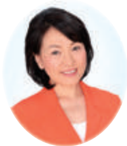
衆議院議員 あべ 俊子