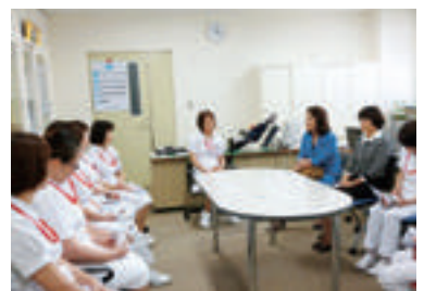
独立行政法人国立病院機構 別府医療センター(別府市)

大分県では、国立病院機構の病院を初めて訪問させて頂きました。休日でしたが、師長さん方にお会いして、現場の課題を伺いました。